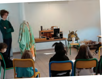
Découverte de « L'Opéra de Massy en balade » avec un groupe d'enfants en octobre dernier.