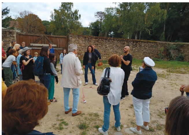
21 & 22 septembre : Journées européennes du patrimoine Balade avec escales théâtrales, par la compagnie des Hermines.