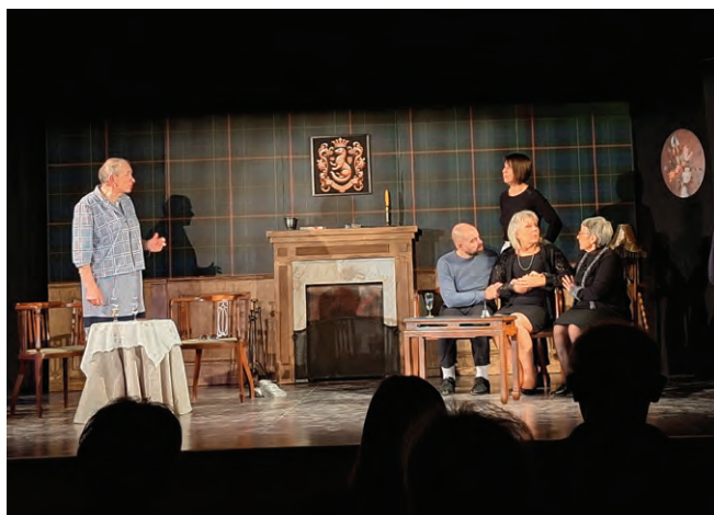
22, 23 et 24 novembre « La parade de Mister Auguste », une comédie de François TINLOT présentée par La Compagnie des HERMINES.