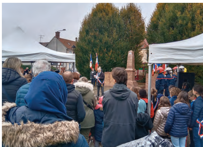
Cérémonie du 11 novembre Nous avons célébré le 106 e anniversaire de l'armistice signé en 1918, qui a mis fin aux combats de la Première Guerre mondiale. Journée Nationale du Souvenir et des Anciens Combattants.