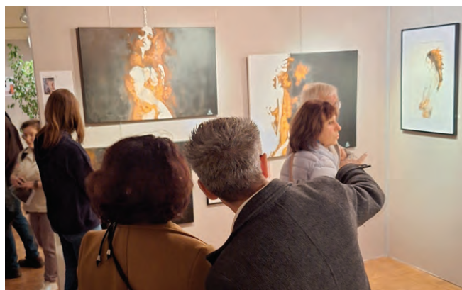
12 au 20 octobre : 15 e édition du Salon d'Art Pour cette 15 e édition du Salon d'art, une vingtaine d'artistes sont venus exposer leurs œuvres d'art. L'invité d'honneur était Olga ALEKSANDROVA, médaillée d'or RMN en 2018 (Grand Palais, Paris). En partenariat avec le Centre d'Art Contemporain Brétigny.