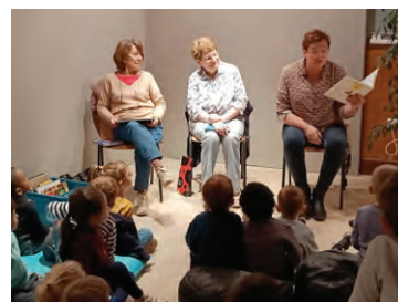
Les bibliothécaires bénévoles invités lors du Salon d'Art pour décliner des histoires à croquer l'Art devant le jeune public.