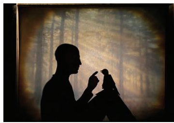
Spéctacle « À petits pas dans les ombres » pour les tout-petits (0/3 ans) avec la Compagnie Daru-Thempô.