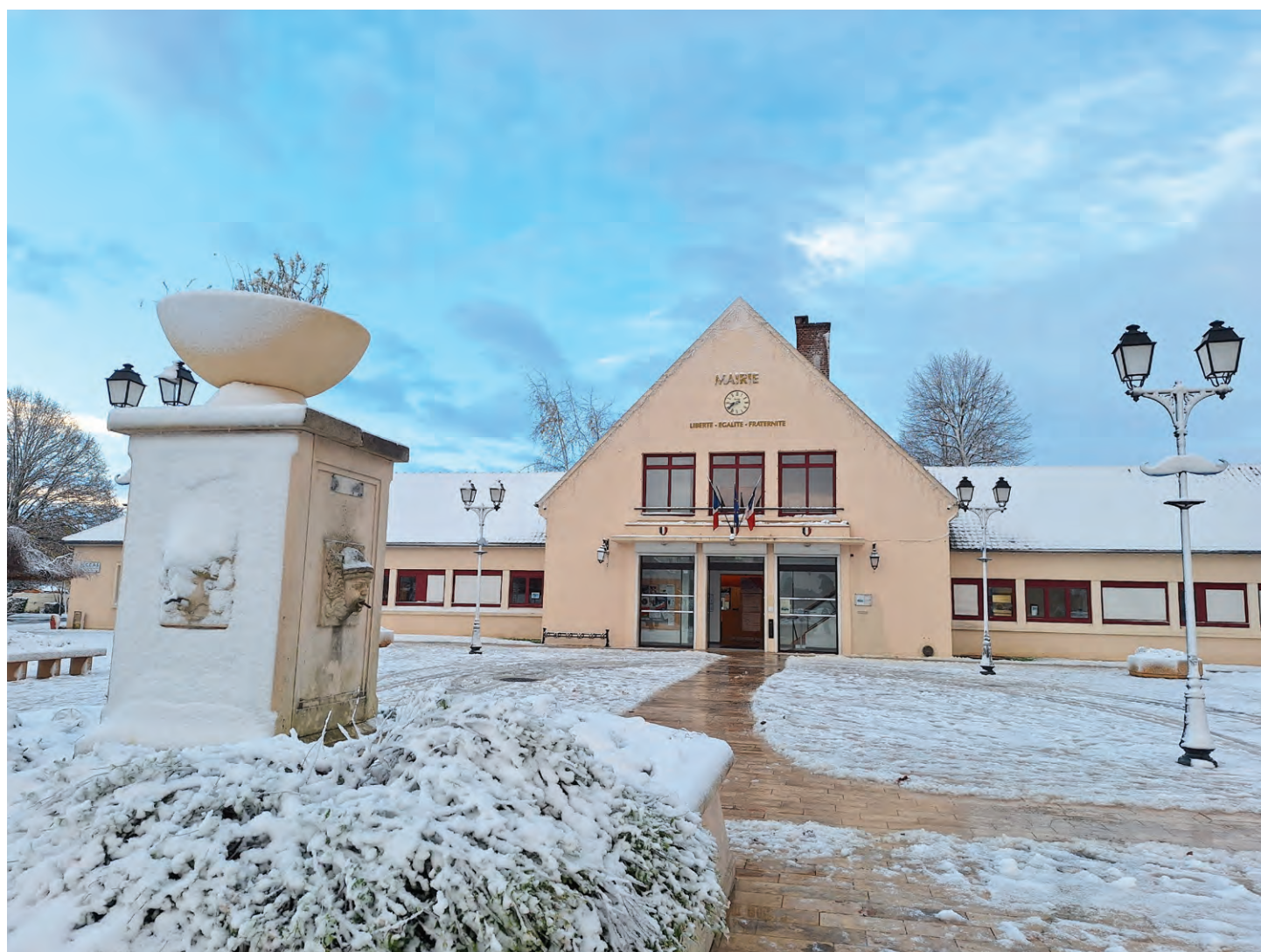
Le parvis de la mairie enneigé.

MAIRIE | 1 avenue Charles de Gaulle - 91630 Marolles-en-Hurepoix | Tél. : 01 69 14 14 40 | Fax : 01 69 14 14 59 | Mail : mairie@marolles-en-hurepoix.fr | Site : https://Marolles-en-hurepoix.fr | Responsable de la publication : Mairie de Marolles-en-Hurepoix | Directeur de la publication : Georges JOUBERT | Maire-adjoint en charge de la communication : Francis PREUD'HOMME | Chargé de communication : Karl CHARLOT | Réalisation : Sandra CAUDRON | Imprimeur : IMPRIMERIE PAYARD, certifiée Imprim'vert . Photo 1 ère de couv. : la cérémonie des vœux de M le maire, ©photo : Karl CHARLOT. Photo 2 e de couverture : premières neiges à Marolles. ©photo: Annabelle LANGLOIS | ©Photos : images libres de droits : Adobe stock. | Les textes doivent être fournis par mail à communication@marolles-en-hurepoix.fr ou sur clé USB et les photos numériques en format jpg, haute résolution. Les photos en épreuve imprimante ne seront pas acceptées.