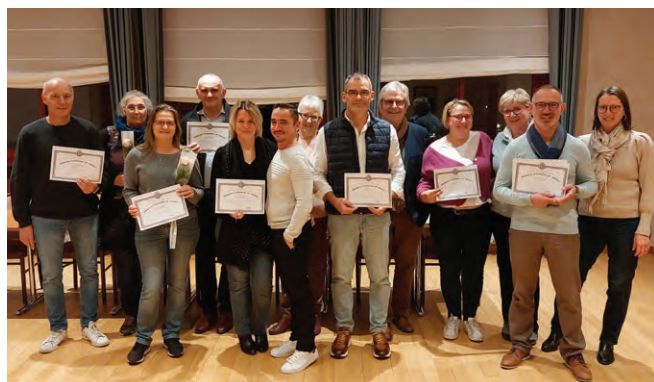
15 novembre : remise des médailles du travail 8 médailles d'honneur du travail ont été remises, une distinction honorifique pour ces Marollais.