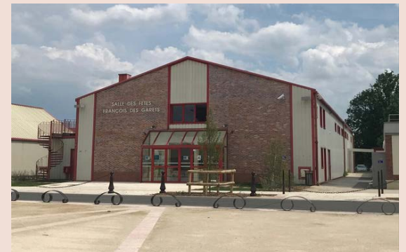
Salle des fêtes François des Garets