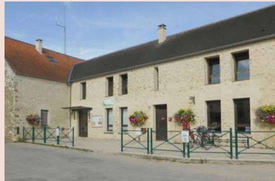
Centre de loisirs