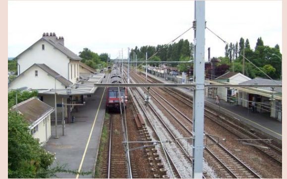
Gare SNCF Ligne RER C, bus et TAD