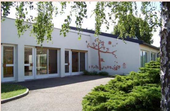
École maternelle Gaillon