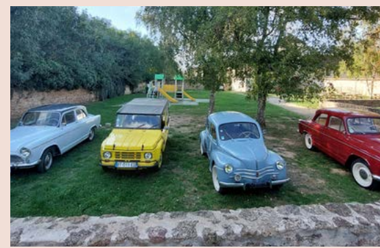
Journée européenne du patrimoine