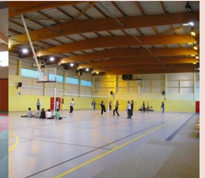
Salle de sport