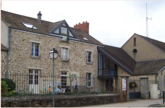
Halte-Garderie « La Farandole »