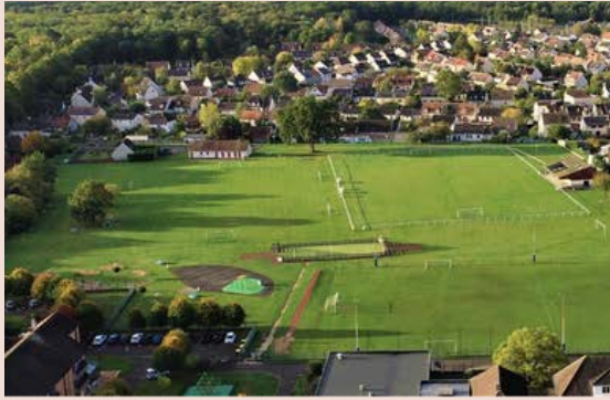
Stade Norbert Bâtigne