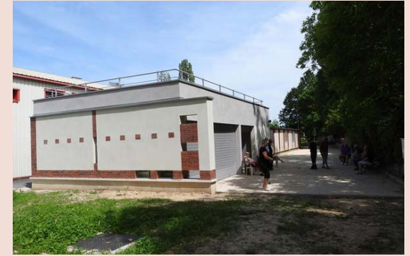
Terrains de pétanque