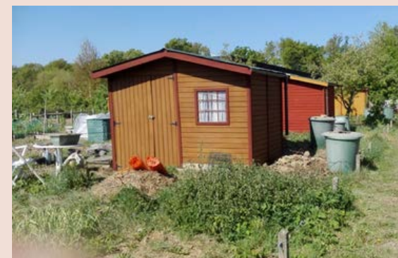
Les potagers de Marolles

Associations sensibles à l'environnement :