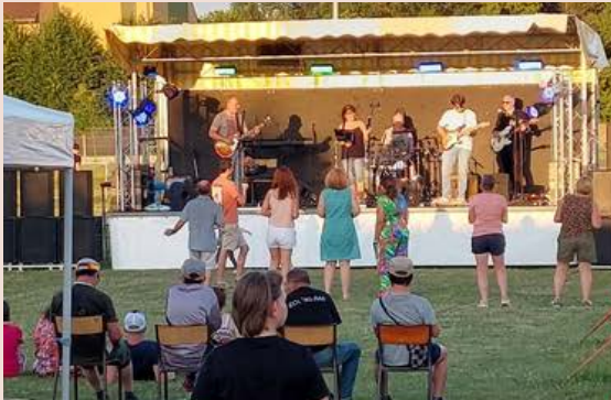
Marolles en Zik