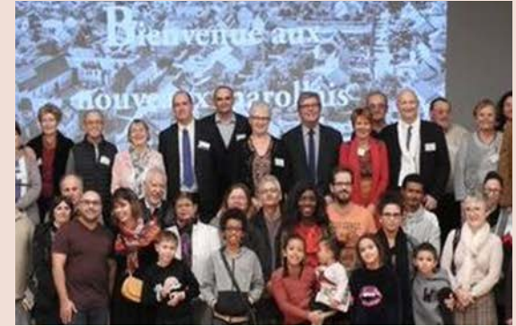
Accueil des nouveaux Marollais