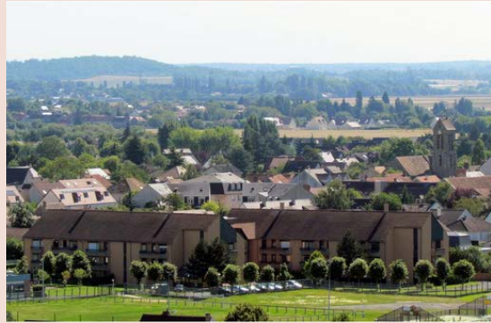
Résidence autonomie (RPA)