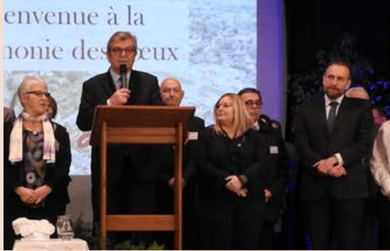
Vœux du Maire à la population