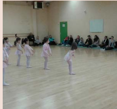
Salle de danse