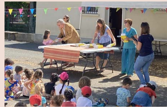
Remise des dictionnaires