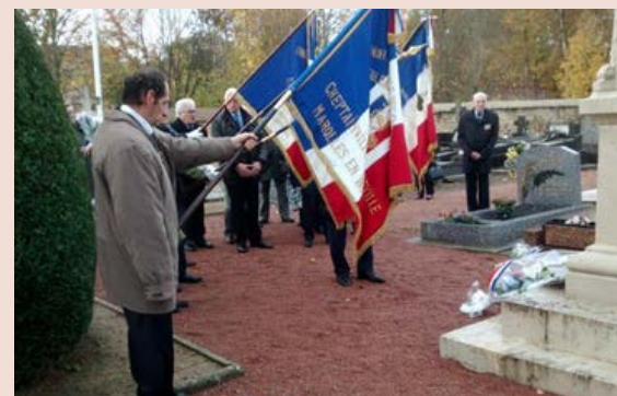
Union des Anciens Combattants