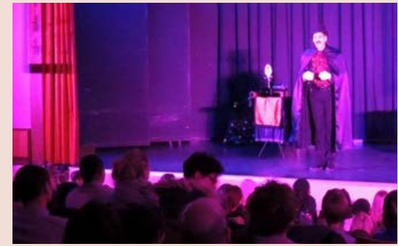
Noël des enfants Marollais