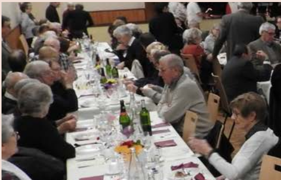
Repas des séniors