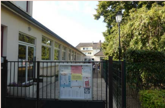
École maternelle Roger Vivier

« Atlan13 » dès l'entrée en 6ème, jusqu'à la veille de la majorité