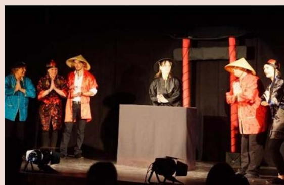
La Compagnie des Hermines