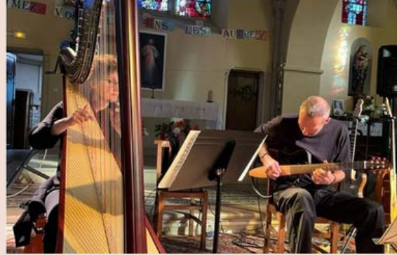
Concerts - Spectacles