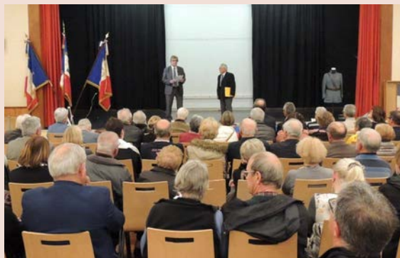
Histoire et Patrimoine