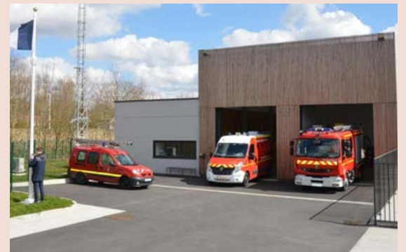
Centre de secours