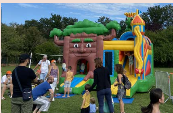
Fête de la rentrée