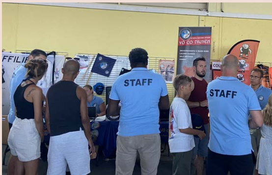
Journée des associations