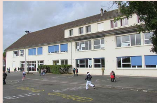
École élémentaire Roger Vivier