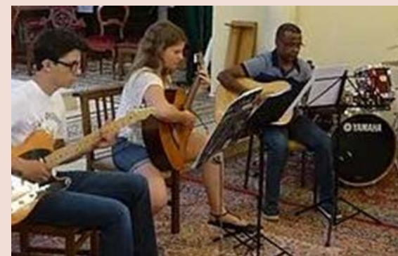
École de musique