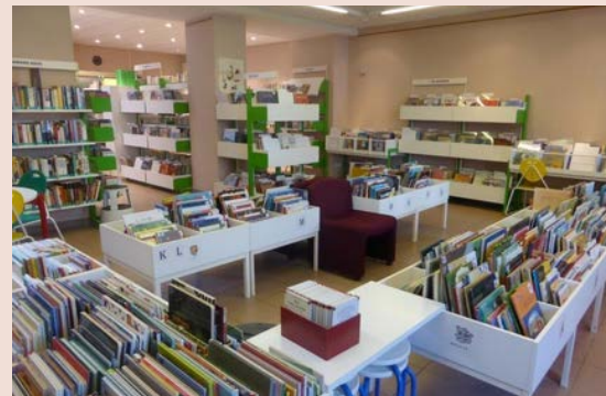
Médiathèque Jean Farges