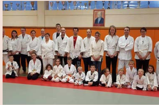
USM Ju Jit So