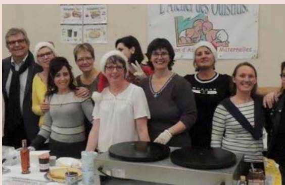
Atelier des Ouistitis

Associations scolaires et petite enfance :