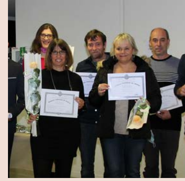
Remise des médailles du travail