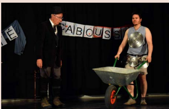
La Compagnie Fauga