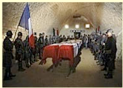
Chapelle ardente dans une casemate de la citadelle de Verdun