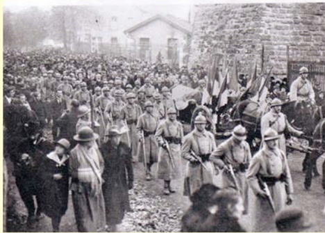
Conduite du cercueil jusqu'à la gare, pour son acheminement vers Paris

André MAGINOT, ministre des Pensions, s'est avancé vers un des jeunes soldats qui assurait la garde d'honneur, et qui lui demande, en présentant un bouquet d'œillettes blancs et rouges, de le déposer sur un des huit cercueils. «que vous choisirez sera le soldat inconnu, que le peuple de France accompagnera demain sous l'Arc de triomphe».