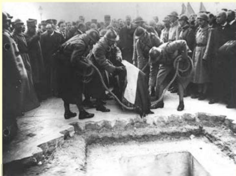
Préparatifs et descente du soldat inconnu dans sa dernière demeure