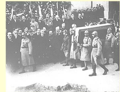
Arrivée du cercueil sous l'Arc de Triomphe