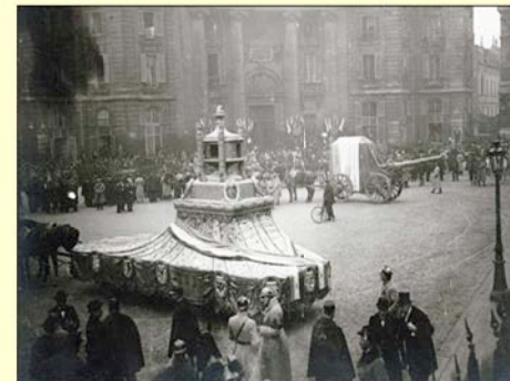
Le cœur de Gambetta et le cercueil du soldat inconnu devant le Panthéon