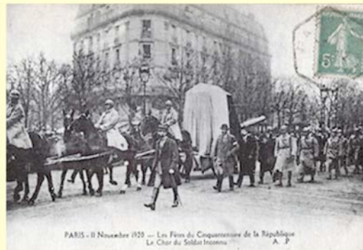
PARIS - 11 Novembre 1920 - Les Fins du Conquérant de la République Le Char du Soldat Inconnu A. P.