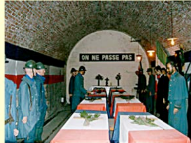
Reconstitution de la cérémonie dans la casemate de la citadelle de Verdun

En 1919 et 1920 une campagne de presse propose l'inhumation d'un soldat inconnu sous l'Arc de Triomphe. C'est le 8 novembre 1920, que les députés réunis en session extraordinaire adoptaient la loi concernant «translation et l'inhumation des restes d'un soldat français non identifié» le 11 novembre 1920 sous l'Arc de Triomphe