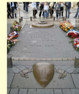
Le tombeau de nos jours