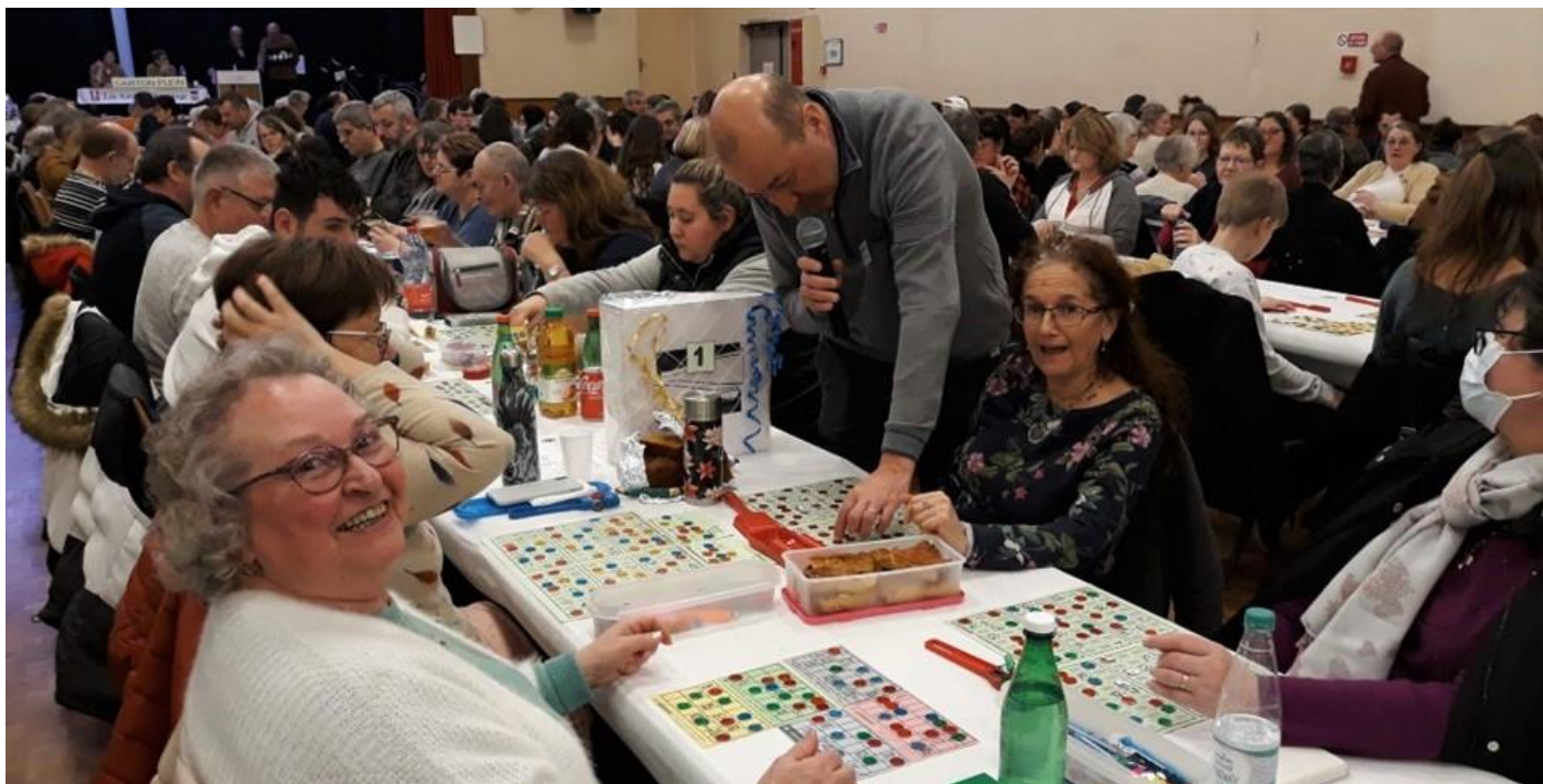
C'est beau le sourire d'une table gagnante.