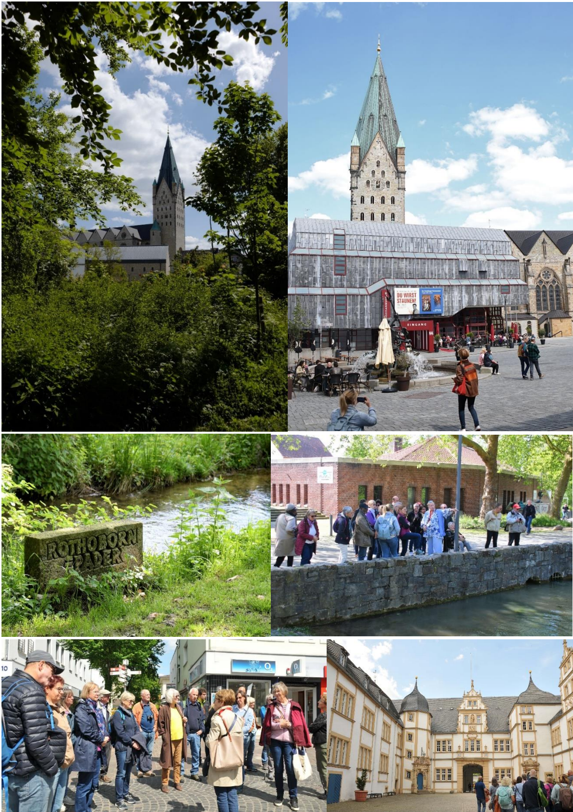
Paderborn et le château de Neuhaus