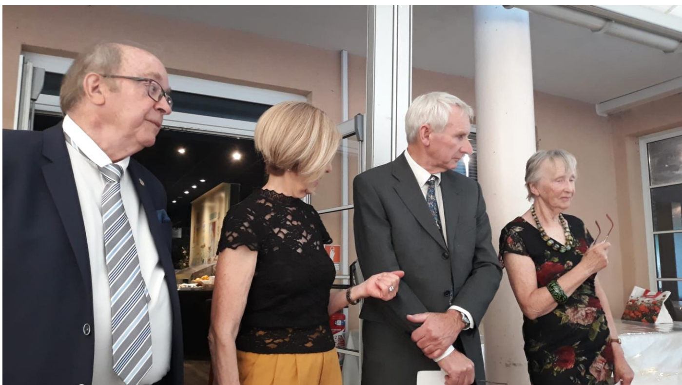
Le temps des discours