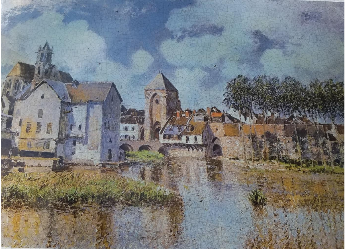
Moret peint par Sisley

Pictural surtout, par la beauté du paysage qui a attiré de nombreux peintres impressionnistes et particulièrement Alfred Sisley.