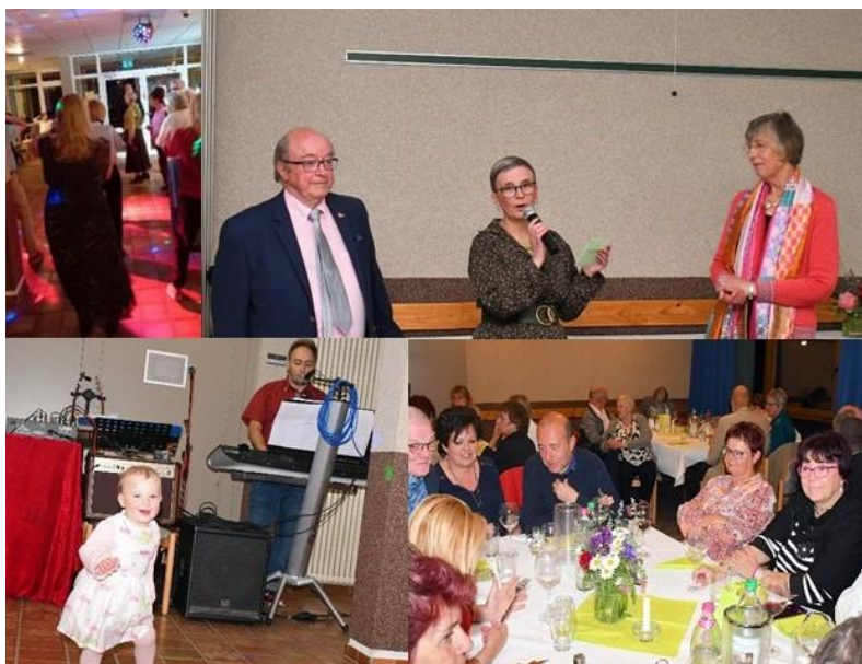
Repas dansant, même les bébés participent