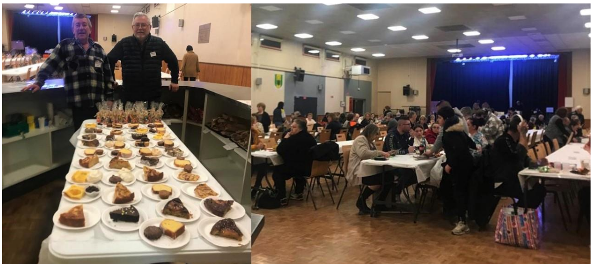
Grâce au travail de tous, le bar et ses barmen était prêts à l'heure.