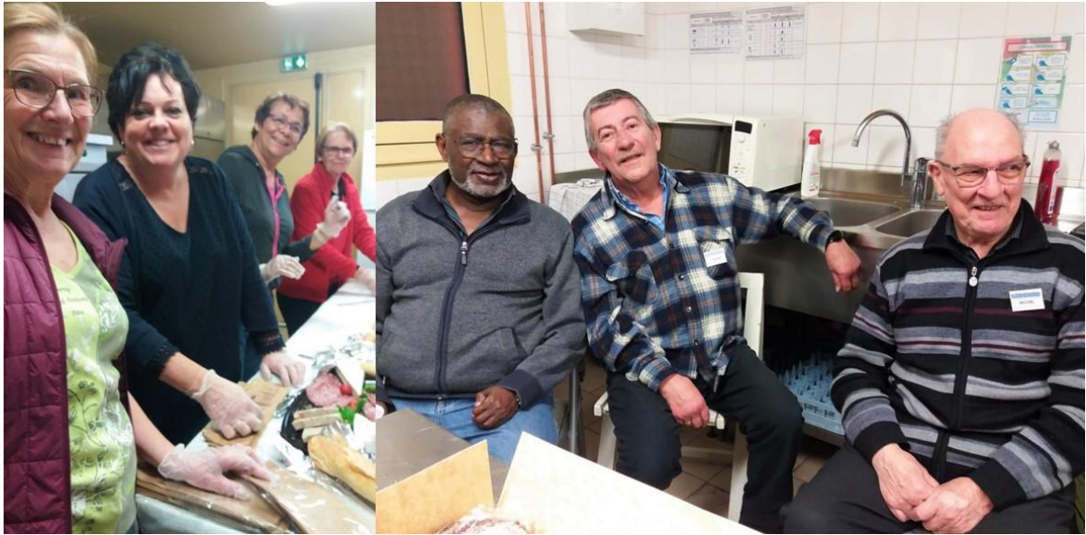
Toute le monde s'est activé dans la bonne humeur.