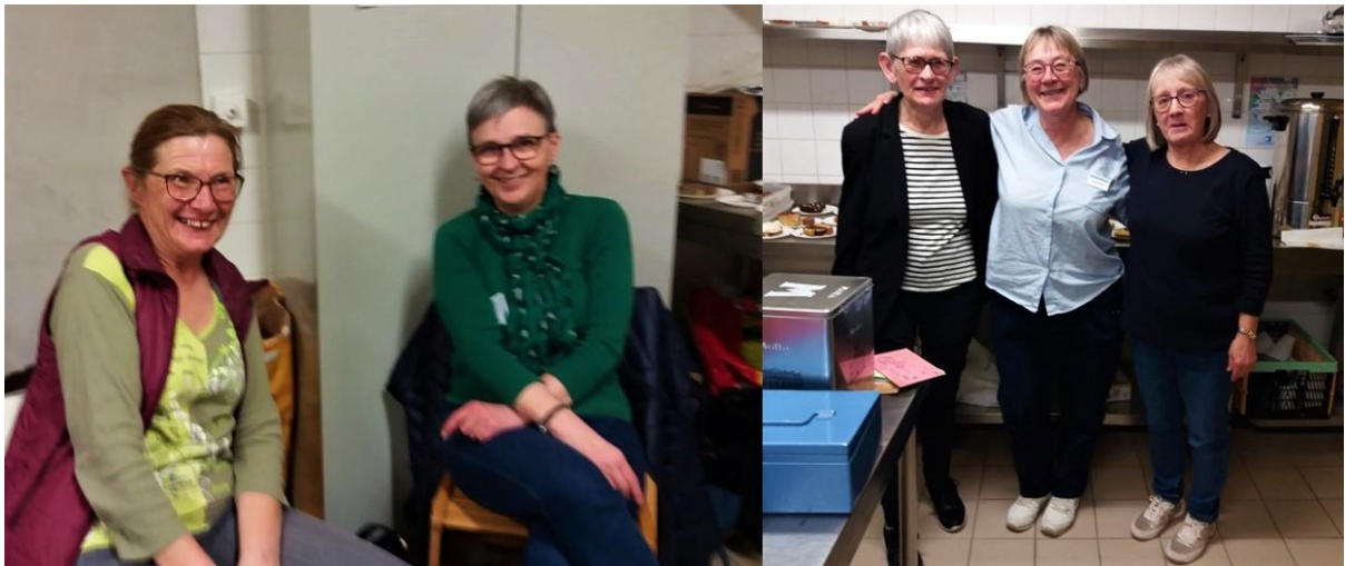
Une petite séance photos mesdames avant l'ouverture des portes.