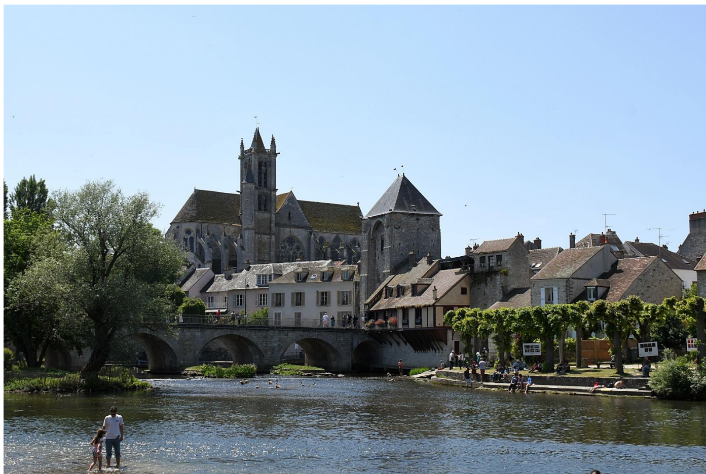
Vue de Moret depuis la prairie

Malgré une arrivée tardive la veille, c'est avec un départ matinal et bon pied, bon œil que le groupe est parti découvrir la ville de Moret-sur-Loing, en Seine et Marne. Cité médiévale et royale datant du XII ème siècle Moret-sur-Loing a conservé de nombreux monuments tels que les remparts, les portes de Bourgogne et de Samois, la configuration du centre-ville aux rues étroites et ruelles descendant vers la rivière, la mairie au style néo-gothique et la galerie François 1 er à l'histoire rocambolesque, sans oublier Notre Dame de la Nativité, église à l'architecture gothique et étape des pèlerins sur le chemin de Compostelle.