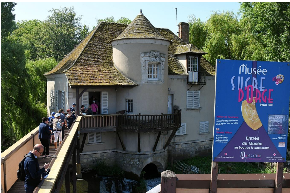
Moulin Provencher qui héberge le musée du sucre d'orge

Moret-sur-Loing recèle bien d'autres trésors. Gustatif tout d'abord avec le Sucre d'Orge de Moret, connu et apprécié depuis plus de 300 ans dont la fabrication remonte à 1638 par les Religieuses Bénédictines.