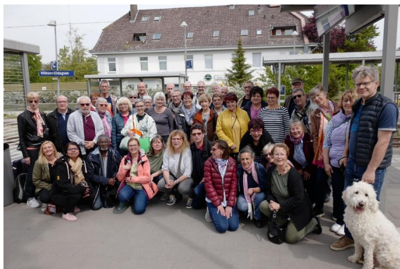
La photo de groupe