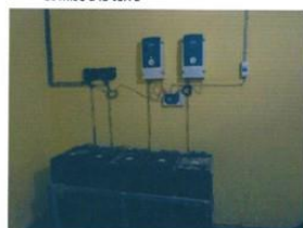
Photo N° 03: Vue d'ensemble Batteries, Convertisseurs et Régulateur