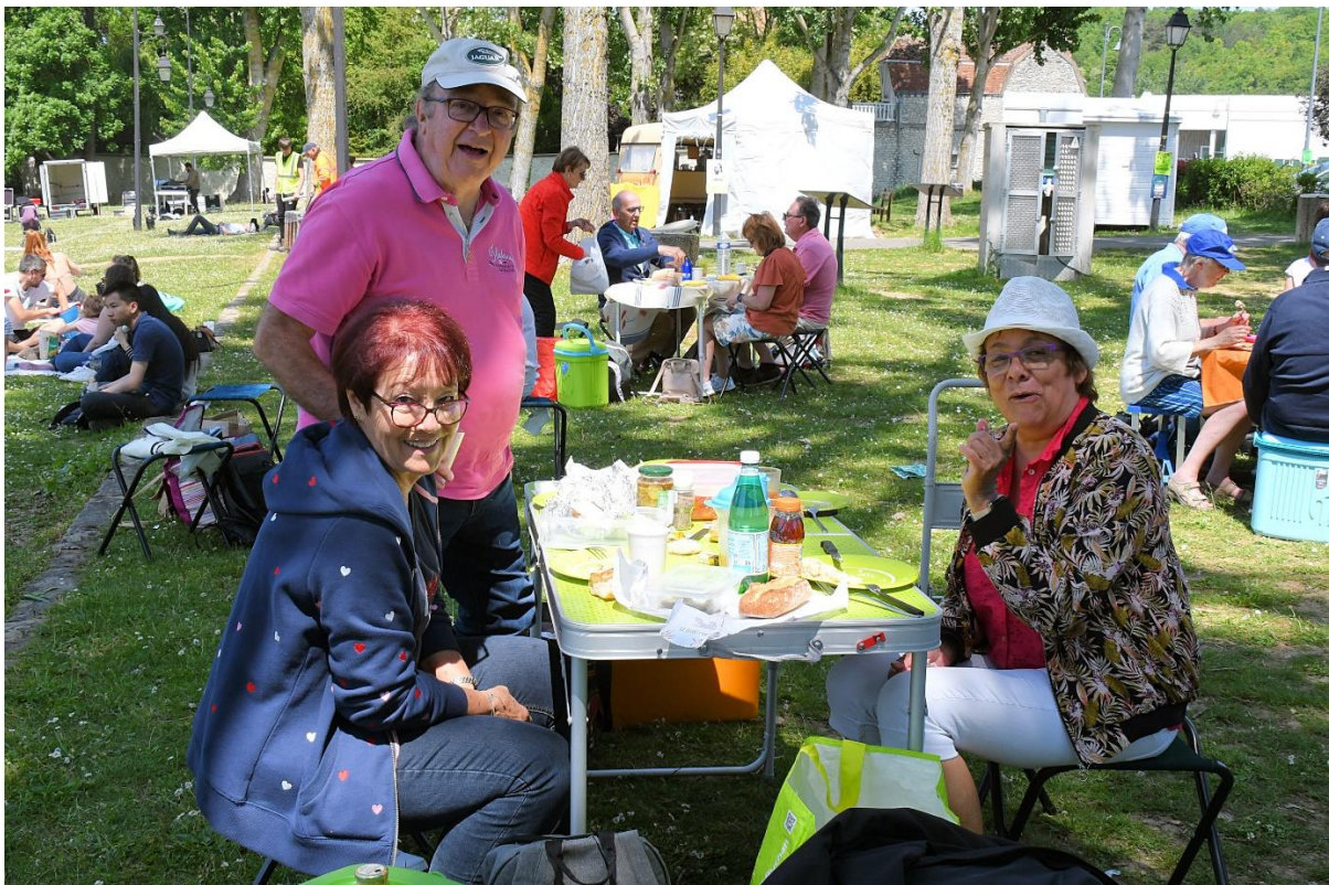
Le pique-nique dans un lieu fort agréable