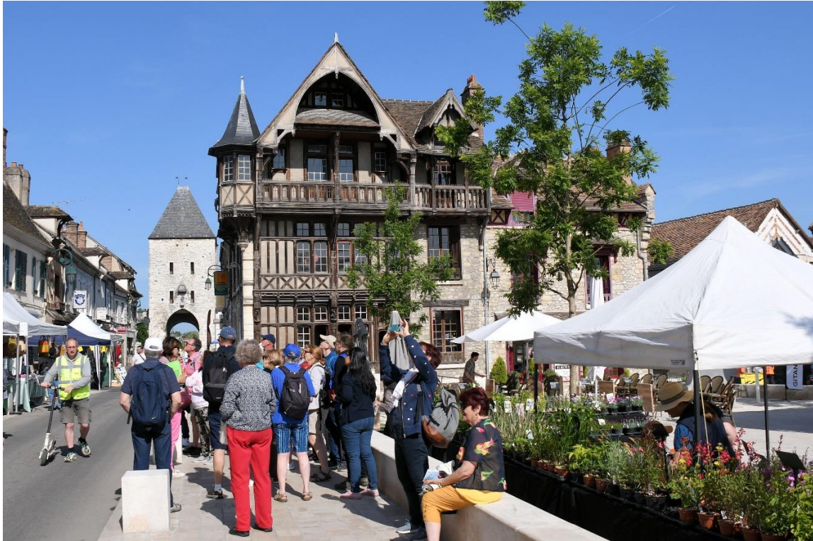
Porte de Samoïs et maison Racollet

Moret-sur-Loing recèle bien d'autres trésors. Gustatif tout d'abord avec le Sucre d'Orge de Moret, connu et apprécié depuis plus de 300 ans dont la fabrication remonte à 1638 par les Religieuses Bénédictines.