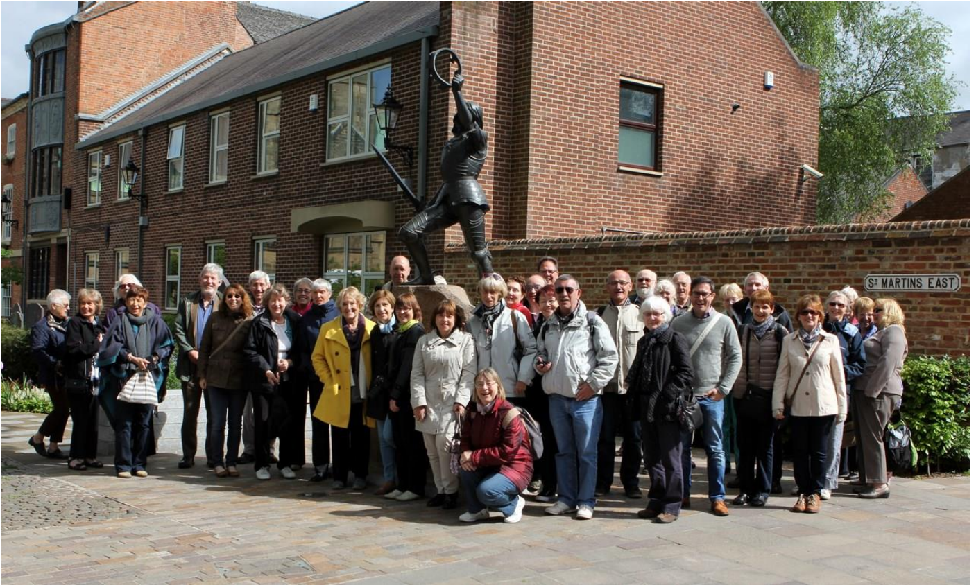
Photo du groupe lors de la visite de Leicester

Visite à nos amis de Southam – Pentecôte 2016, du 13 au 16 mai